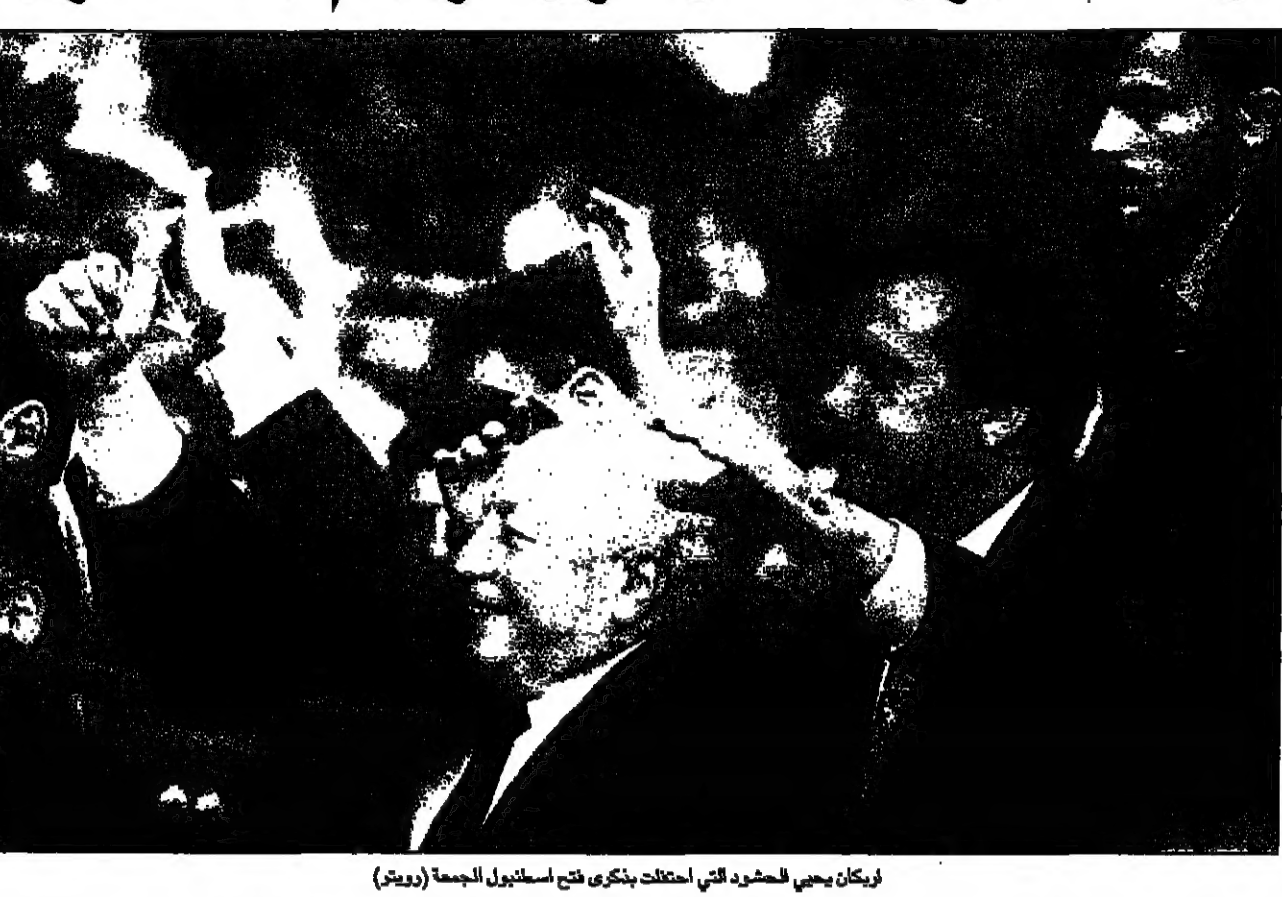
اربكان يحيي الحشود التي احتلت بشكري فتح اسطنبول الجمعة

الطالباني: الطائرات التركية تقصف المدنيين بشمال العراق حكومة اربكان تفقد اغلبيتها في البرلمان والاسلاميون يستعرضون قوتهم باسطنبول